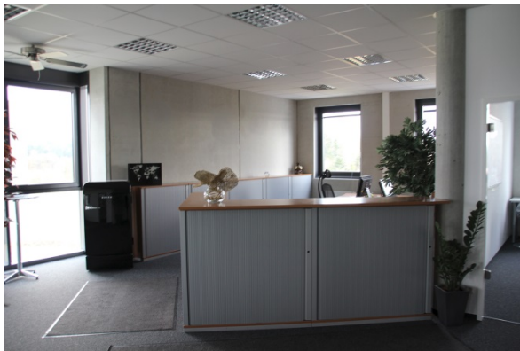
Musterbüro: Empfang (Mieteretage)