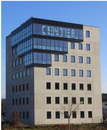
Ansicht von Westen.