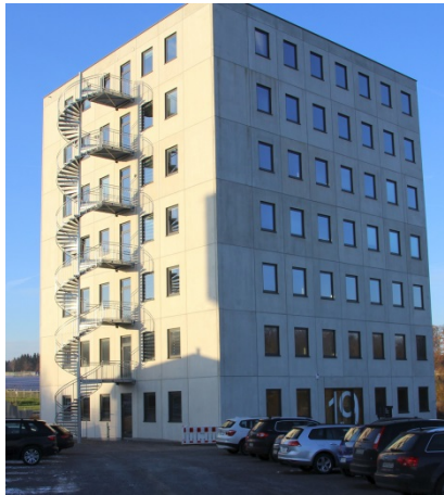
Ansicht von Süden.