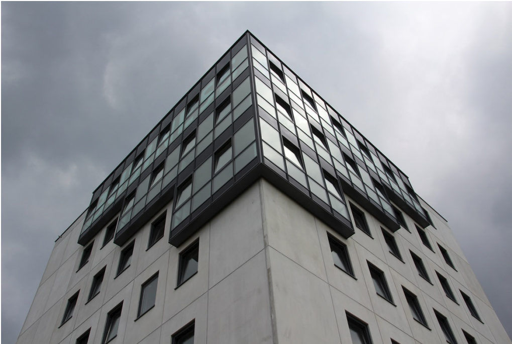
Ein echter „Hingucker“ an der A8 Karlsruhe – Stuttgart, Ausfahrt Heimsheim.