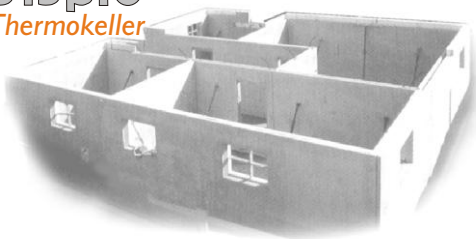
Das modernste Kellerbau-System am Markt

Das Ergebnis: Ein ausgereiftes Kellerbau-System, das ärgerliche Baufehler, Terminverzögerungen und teure Folgeschäden nicht mehr zuläßt. Dazu mit einer integrierten Technik, die so perfekt und präzise auf der Baustelle nicht gebaut werden kann.